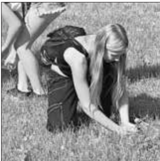
Schülerin beim Feldversuch

In der Praxis sah das Erlebnis-Programm für die Realschule Schonungen verschiedene Stationen vor, an denen aktiv geforscht und gelernt wurde: Die erstaunliche Biodiversität in unseren Wiesen und Hecken, Bedürfnisse und Haltungsformen bei Hühnern, Erfühlen der Bodenqualität und Erproben der Wasseraufnahmebereitschaft verschiedener Flächen.