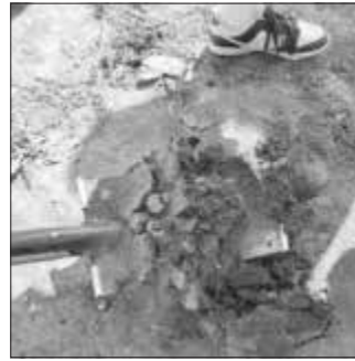
Ein Spaten eigener Boden für den Vergleich bei der Fingerprobe