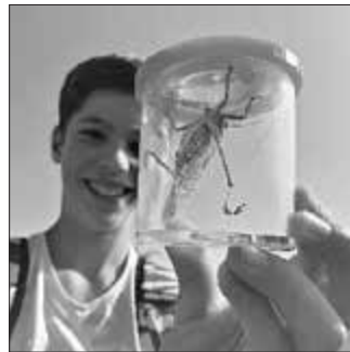
Ein kolossaler Fang bei der Erkundung der Artenvielfalt in Wiesen und Hecken