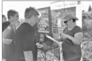
Schüler beim Wissensquiz