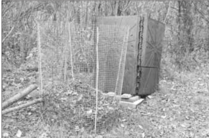
Selbst gebauter Laubkompostbehälter aus Volierendraht.

ren und Rhododendren verwendet werden. Generell empfiehlt die Gartenexpertin Gartenerde und Kompost alle paar Jahre von Bodenlaboren untersuchen zu lassen, da jeder Garten unterschiedliche Voraussetzungen mit sich bringt. Die Ergebnisse geben Anhaltspunkte für die am besten geeignete Verwendung des „Gärtnerschatzes“.