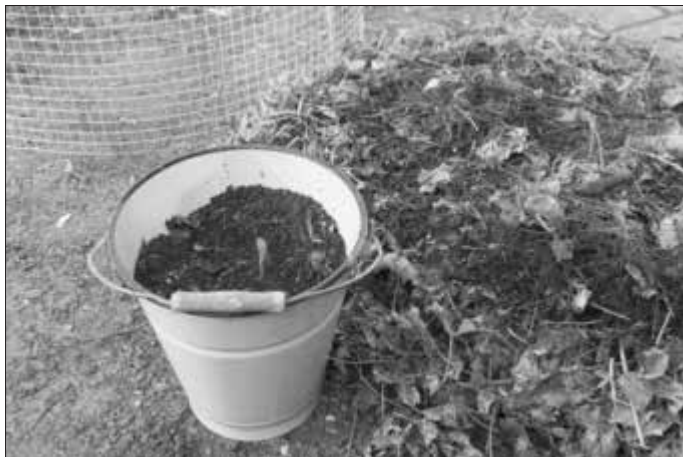
Lauberde nach einem Jahr Kompostierung