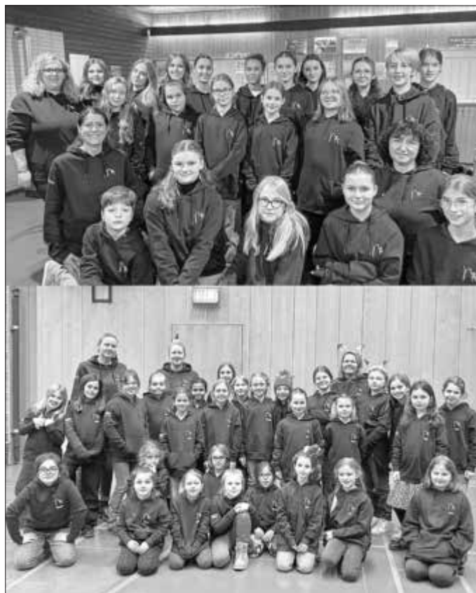
Bild oben Ju15_Ju19 / Bild unten Ju09_Ju12