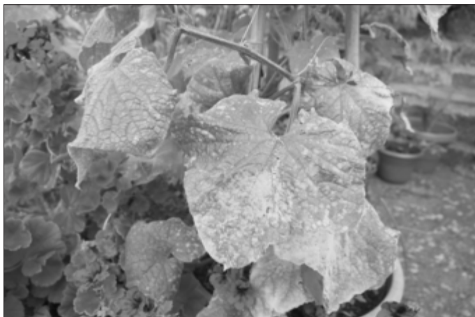
Echter Mehltau an Gurkenpflanze

Obst: Weinreben, Brombeere, Stachelbeere