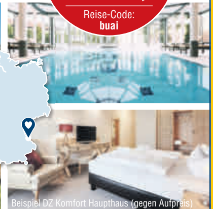
Beispiel DZ Komfort Haupthaus (gegen Aufpreis)