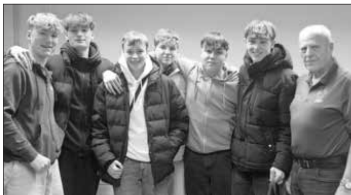
Die jüngst teilnehmende Mannschaft mit Spielern aus der U 17.