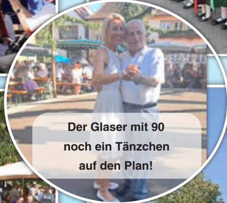
Der Glaser mit 90 noch ein Tänzchen auf den Plan!