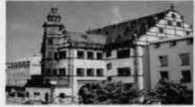
OV Schweinfurt Ost und Nord